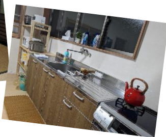
ひとつおりのキッチン グッズが揃っています