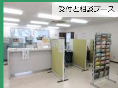
受付と相談ブース