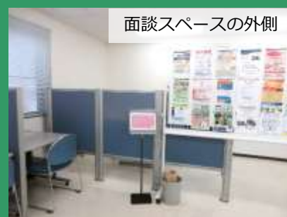
面談スペースの外側