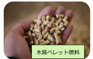
木質ペレット燃料