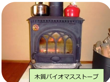
木質バイオマスストーブ